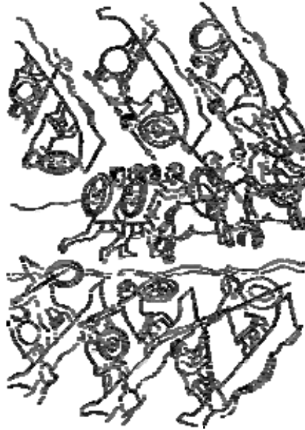
Huida de los españoles y sus aliados por la calzada de Tlacopac [Tacuba] (Códice Florentino)

Pero al llegar a Petlascalco en donde hay otro canal, en paz y quietamente lo pasaron sobre el puente portátil de madera.