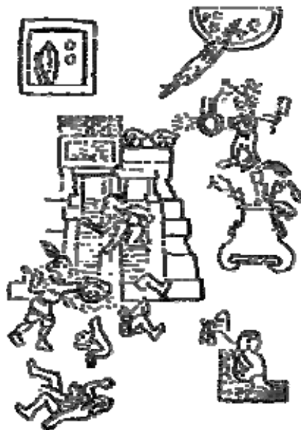
Visión de la Conquista (Códice Vaticano A.)

Vinieron a decir a aquellos que ataviaron a Huitzilopochtli.