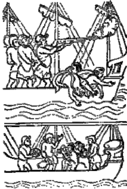
Los españoles reciben a los mensajeros de Motecuhzoma ( Códice Florentino )

-Es todo: con eso hemos venido, señor nuestro.