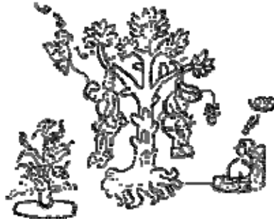
Rendición de los mexicas (Lienzo de Tlaxcala)

Entonces habla Cuauhtémoc, le dice al Cihuacóatl: