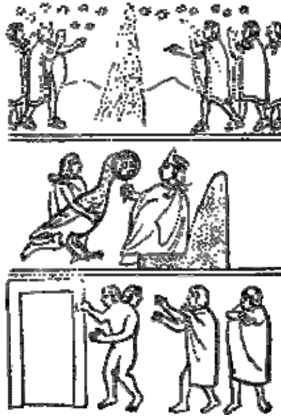
Presagios Funestos (Codice Florentino)

El tercer prodigio y señal fue que un rayo cayó en un templo idolátrico que tenía la techumbre pajiza, que los naturales llamaban Xacal, el cual templo los naturales llamaban Tzonmolco, que era dedicado al ídolo Xiuhtecuhtli, lloviendo una agua menuda como una mullisma cayó del cielo sin trueno ni relámpago alguno sobre el dicho templo. Lo cual asimismo tuvieron por gran abusión, agüero y prodigio de muy mala señal, y se quemó y abrasó todo.