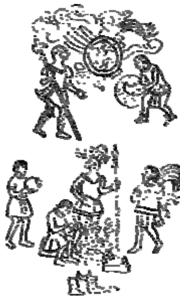
Los españoles funden los presentes de oro (Códice Florentino)

Van ya en seguida a la casa de almacenamiento de Motecuhzoma. Allí se guardaba lo que era propio de Motecuhzoma, en el sitio de nombre Totocalco . 46 Tal como si unidos perseveraran allí, como si fueran bestezuelas, unos a otros se daban palmadas: tan alegre estaba su corazón