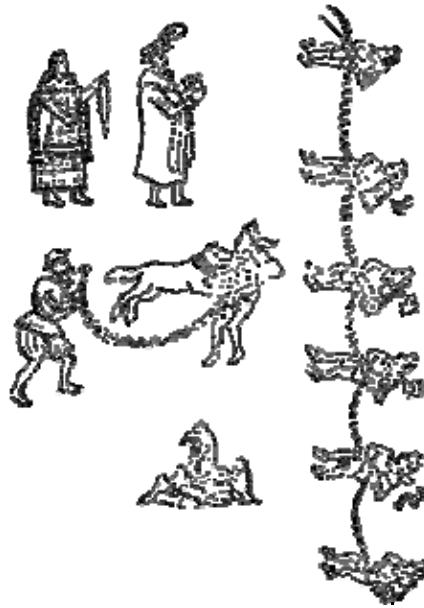
Hoja del apericamiento (Proceso de Alvarado)

Luego se les dieron indios vasallos en todos estos pueblos. Fue entonces cuando se dieron personas en don, fue cuando se dieron como esclavos.