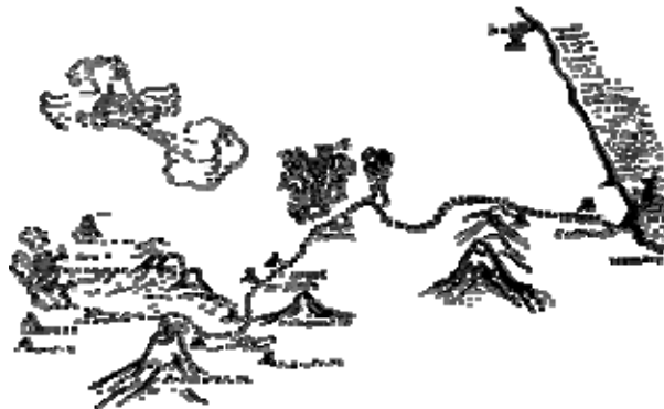
Ruta de los conquistadores

Los resultados fueron diversos. Hubo "proyecciones" de viejas ideas. Se pensó, por ejemplo, que determinados indígenas eran en realidad los descendientes de las tribus perdidas de los judíos. Tal es el caso de fray Diego de Durán a propósito del mundo náhuatl. Otras veces las relaciones e historias eran una apología más o menos consciente de la Conquista, como en el caso de Hernán Cortés. En algunas crónicas aparecen los indígenas del Nuevo Mundo como gente bárbara, idólatras entregados a la antropofagia y a la sodomía, mientras que en otras son descritos como dechado de virtudes naturales.