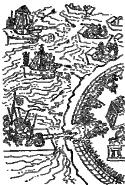
Asedio de la ciudad desde los bergantines (Códice Florentino)

Pero nuestros enemigos se apoderaron de las cosas, haciendo fardo con ellas, van tomando cuanto hallan por donde van pasando todo lo que sale a su paso. Toman y arrebatan las mantas, las capas, las frazadas, o las insignias de guerra, los tambores, los tamboriles.