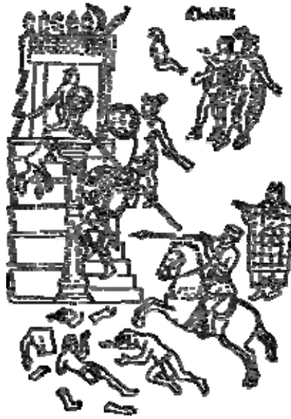
La matanza de Cholula (Lienzo de Tlaxcala)

Tenían tanta confianza los cholultecas en su ídolo Quetzalcohuatl, que entendieron que no había poder humano que los pudiese conquistar ni ofender, antes acabar a los nuestros en breve tiempo, lo uno porque eran pocos, y lo otro porque los tlaxcaltecas los habían traído allí por engaño a que ellos los acabaran, pues confiaban tanto en su ídolo, que creían que con rayo y fuego del cielo los habían de consumir y acabar y anegar con aguas.