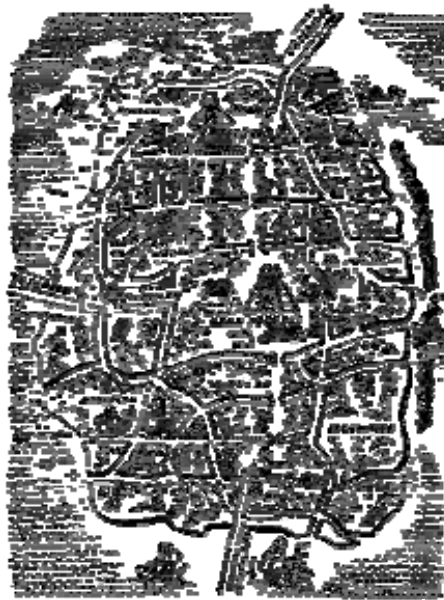
Ciudad de Tenochtitlan

De estos testimonios, además del ya citado Lienzo de Tlaxcala, se aducen aquí algunos textos tomados de la Historia de Tlaxcala , redactada en castellano por Diego Muños Camargo, mestizo que escribió durante la segunda mitad del siglo XVI. Es particularmente interesante su versión, claramente tendenciosa, de la matanza de Cholula, texto que se incluye en el capítulo V de este libro.